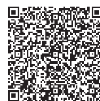
直営寮の紹介動画